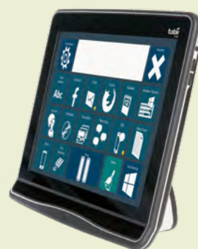
Tobii Dynavox I-15+ mit Augensteuerung

Bei sehr starken motorischen Beeinträchtigungen kann der Einsatz einer Augensteuerung (z.B. von Tobii Dynavox) notwendig werden. Eine Augensteuerung ermöglicht die Bedienung der Kommunikationsoberfläche durch Blicke bzw. durch gezieltes Hinsehen.