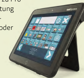
Tobii Dynavox I-110

Der Communicator ist sowohl auf dem kleinen, leichten I-110 als auch auf den großen Geräten der Tobii Dynavox I-Serie enthalten.