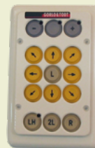
Compactmaus: Tastenmaus mit Fingerführung