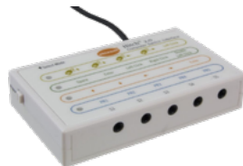
Hitch 2.0: USB-Adapter für die Computerbedienung mit bis zu fünf Tasten

Mit Hilfe eines Anschlussadapters kann ein Computer mit einem oder mehreren Bedienelementen angesteuert werden. Wir bieten zahlreiche Varianten, die sich in Format, Material und Funktion unterscheiden. Hierbei ist es wichtig, ein Bedienelement auszuwählen, das optimal an die Fähigkeiten der AnwenderInnen angepasst ist. Auch die Kombination mit alternativen Tastaturen und Mäusen erlaubt eine ganz individuell auf Ihre Bedürfnisse zugeschnittene PC-Bedienung.