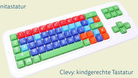
Clevy: kindgerechte Tastatur