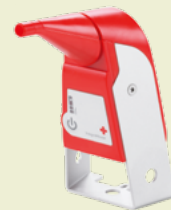
IntegraMouse Plus: PC-Steuerung über den Mund