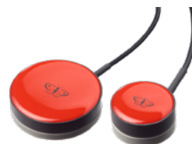
PikoButton: robuster leichtgängiger Taster