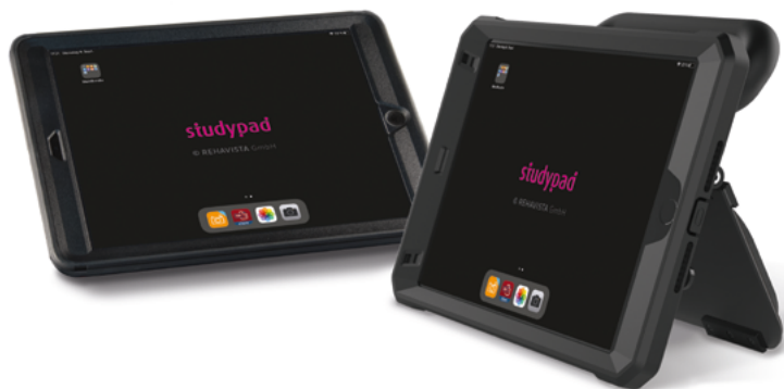
Studypad: ein Komplettsystem für Bildung, Lernen und Arbeit