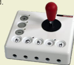
Joyle: robuster Joystick

Gängige Computermäuse erfordern gute feinmotorische Fähigkeiten, um den Mauszeiger auf die gewünschte Position zu setzen und diesen beim Mausklick nicht zu verschieben. Alternativen können sogenannte Mausersatzgeräte sein, die wie auch die Tastaturen auf die unterschiedlichsten Bedürfnisse zugeschnitten sind.